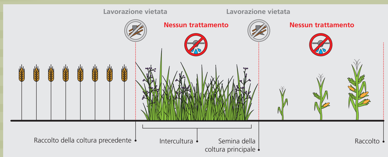
Schema 2 : Nell'ambito delle tecniche colturali senza lavorazione, periodo di riferimento per la rinuncia agli erbicidi