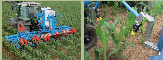
Figura 2: Sistema di polverizzazione localizzata sulla fila abbinato a una zappatura tra le file

B In caso di rinuncia parziale agli erbicidi, non deve essere utilizzato alcun erbicida tra le file. Il trattamento a bande può essere effettuato al massimo sul 50 per cento della superficie della particella o della coltura e deve essere effettuato sulle file. Il trattamento pianta per pianta non è autorizzato.