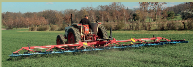
Figura 1: Erpice a sezione larga

A In caso di rinuncia totale agli erbicidi, non deve essere utilizzato alcun erbicida sul 100 per cento della superficie annunciata.