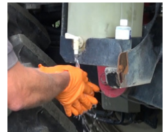
Seife, Frischwasser und Papiertücher: Handschuhe oder Hände müssen auf dem Feld immer gewaschen werden können.