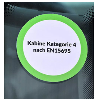
Mit einer Kabine Kat. 4 oder äquivalent (dreistufige Filtrierung) ist beim Ausbringen keine weitere Schutzausrüstung notwendig.